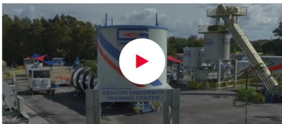
GENCOR MANUFACTURING ORLANDO, FL