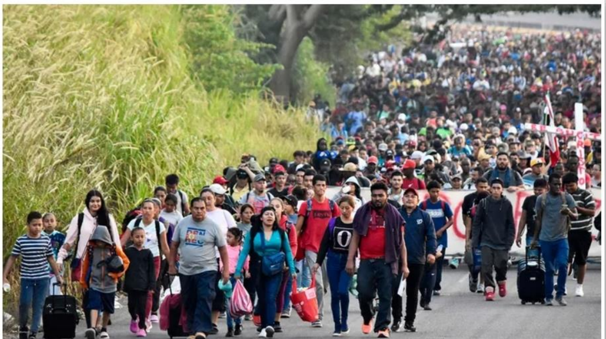
Migrants take part in a caravan toward the border with the United States in Tapachula, Chiapas State, Mexico. Mexican President Andres Manuel Lopez Obrador said that his government would step up efforts to contain irregular migration flows.

Это самый высокий показатель за один месяц, когда-либо зарегистрированный. Кроме того, это первый случай, когда количество встреч с мигрантами превысило 300 000.