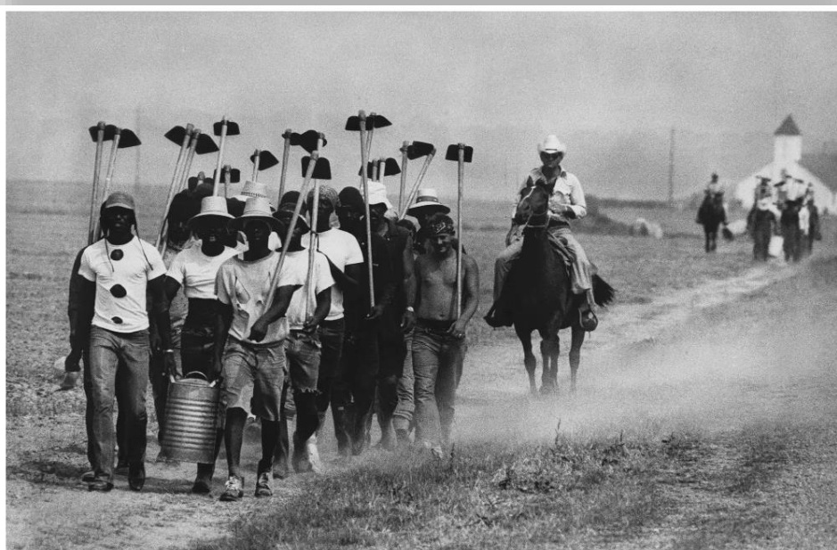
Inmates at Louisiana State Prison in Angola, La., march down a dusty trail on May 30, 1977, en route to working in the fields.