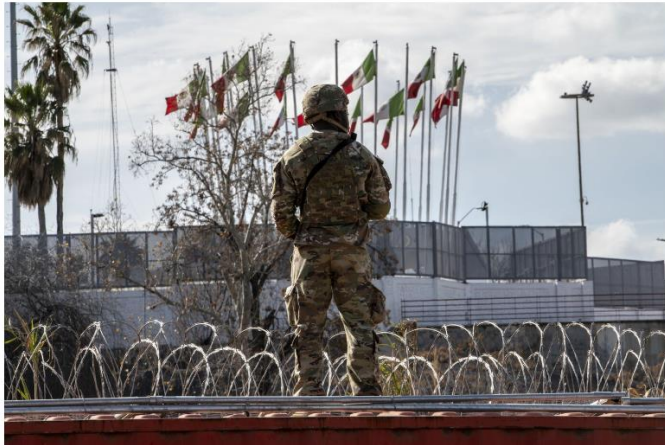
A member of Texas National Guard at Shelby Park along the Rio Grande River in Eagle Pass.

Техас построит «передовую оперативную базу» для размещения войск Национальной гвардии, дислоцированных недалеко от мексиканской границы, заявил в пятницу губернатор Грег Эбботт. Лагерь будет расположен недалеко от Игл-Пасс, горячей точки иммиграции вдоль реки Рио-Гранде, и в отдельных комнатах разместятся до 1800 человек. Согласно заявлению, отправленному офисом губернатора, при необходимости на нем будет место для размещения 500 дополнительных военнослужащих, а также столовая и центр отдыха на 80 акрах земли.